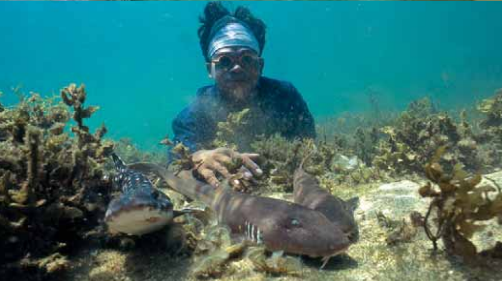
Die Kinder von Nagabat spielen mit Leopardenhaien (ganz links), Katzen- und Ammenhaien (links). Derweil fischen ihre Väter nach Sepien. Die Gesichter schützen sie mit Bankräubermasken vor der sengenden Sonne über und der Kälte unter Wasser

widerstehen sie den Verlockungen der Ausländer und konzentrieren sich vielmehr auf den Fang von Meerestieren, die auf dem lokalen Markt zu einem guten Preis zu verkaufen sind. Dazu zählen vor allem Tunfische und Zackenbarsche. Eine Fischergruppe hat sich übrigens auf Sepien spezialisiert, die in den Gewässern rund um die Insel noch reichlich anzutreffen sind. Dabei machen sich die Männer eine spezielle Fangtechnik, in der Einheimischensprache Muro-Ami genannt, zu nutze. Die Kopffüßer werden unter Wasser lokalisiert und